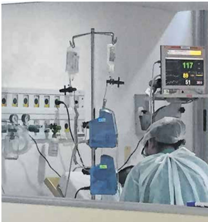
Profissional, toda paramentada, dentro de uma das UTIs de Covid

As mudanças estruturais e na rotina do Hospital Estadual também têm transformado relações humanas por lá. Desde 20 de março, quando as visitas e acompanhantes foram proibidos, as famílias obtêm notícias sobre o estado de saúde de seus entes por meio de boletins preenchidos por médicos. Sensibilizados, muitos profissionais têm caprichado nas letras e também mandado recados de apoio e carinho para as famílias, além de detalhar o dia a dia do paciente. As psicólogas do hospital também estão empenhadas em levar mais conforto aos doentes. Uma vez por dia, elas possibilitam ligações deles para familiares, por meio de tablets.